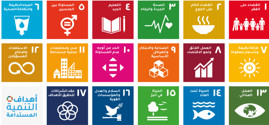
شكل رقم (١)